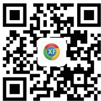
信访举报网站二维码

请扫描右方二维码或直接打开广西纪检监察网 www.gxjjw.gov.cn 点击“我要举报”进行举报。